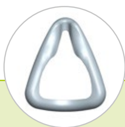
Rys. Kształt: kołnierz nosowy